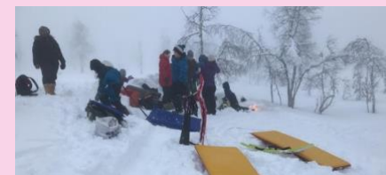
Foto: Fra akedagen på Narsætra

FamilieMorro har samlet en god gjeng så langt. Foreldre melder om at det er deilig med et lavterskeltilbud