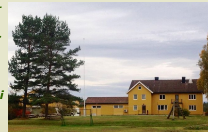
Haraset i Stange er godt egnet som turmål

Vi gjenntar suksessen fra i vinter, og inviterer til ny menighetsweekend på Haraset Leirsted i Stange. Sett av helga den 19. til 21. oktober.