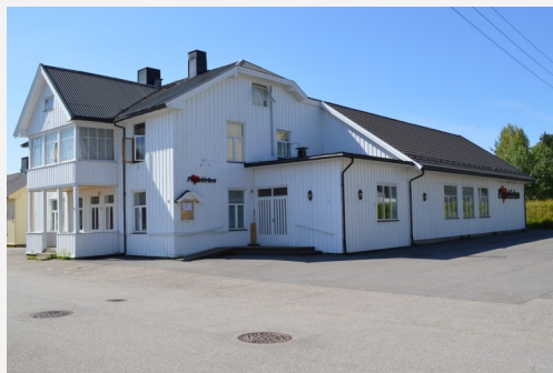
Pinsekirken vurderes solgt. Prisantydning ca. 5 millioner.

På det ekstraordinære årsmøtet i august fikk Lederskapet klarsignal til å legge ut menighetens eiendom i Anne Moes gate for salg. Før et endelig salg kan finne sted kreves det likevel et nytt årsmøtevedtak.