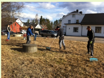
Flinke dugnadsarbeidere i fjor vår.

Onsdag 7. mai fra klokka 18 og utover blir det stor dugnad i og utenfor Pinsekirken. Inne skal det vaskes vinduer og glasskuper. Ute skal det rakes og spyles. Med andre ord her trengs det mye folk, både kvinner og menn.